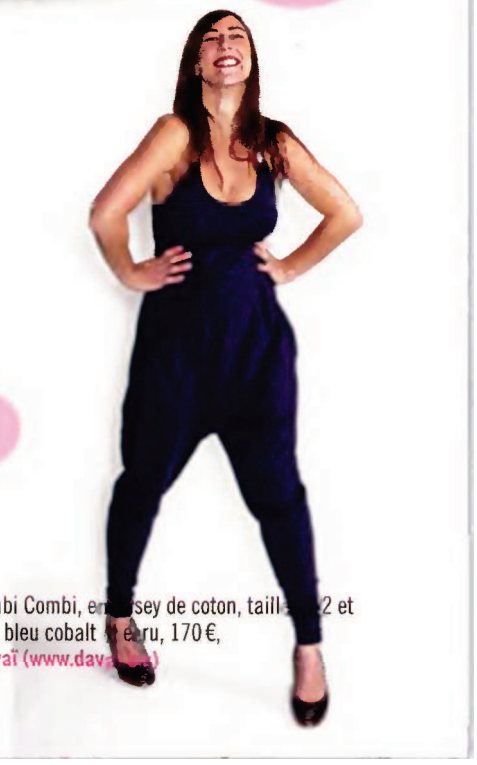
Combi Combi, en jersey de coton, tailles 2 et 3/4, bleu cobalt délavé, 170 €, Davaï ( www.davaï.com ).