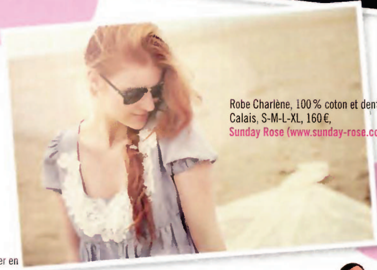
Robe Charlène, 100 % coton et dentelles de Calais, S-M-L-XL, 160 €, Sunday Rose ( www.sunday-rose.com ).