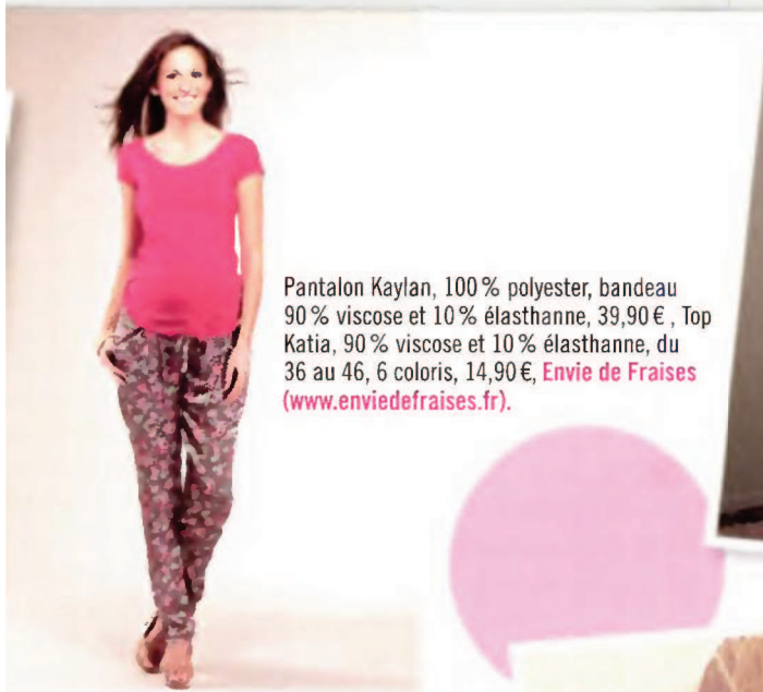
Pantalon Kaylan, 100 % polyester, bandeau 90 % viscose et 10 % élasthanne, 39,90 € , Top Katia, 90 % viscose et 10 % élasthanne, du 36 au 46, 6 coloris, 14,90 €, Envie de Fraises ( www.enviedefraises.fr ).