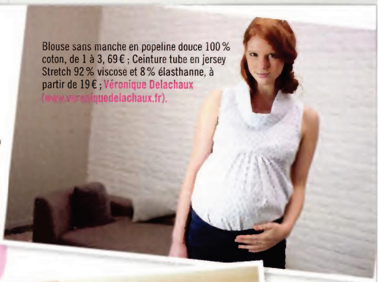
Blouse sans manche en popeline douce 100 % coton, de 1 à 3, 69 € ; Ceinture tube en jersey Stretch 92 % viscose et 8 % élasthanne, à partir de 19 € ; Véronique Delachaux ( www.veronique-delachaux.fr ).