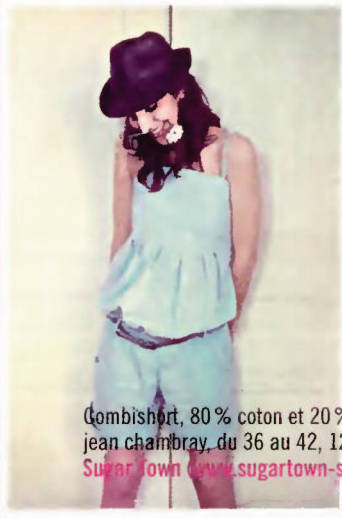
Combi short, 80 % coton et 20 % polyester en jean chambray, du 36 au 42, 125 €, Sugar Town ( www.sugartown-shop.fr ).