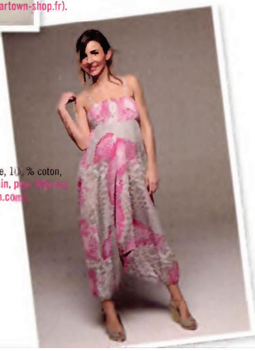
Combinaison Sarouel Charlotte, 100 % coton, du 36 au 40, 45 €, Best Moutain, pour Maman Fashion ( www.mammafashion.com ).